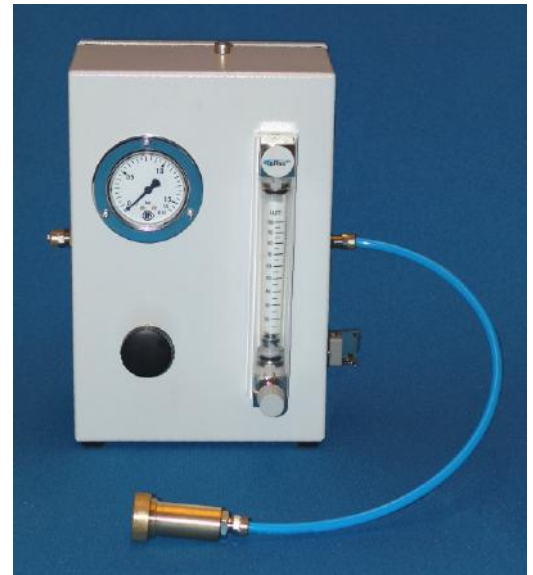
Gasregulierungsmodul für den Einsatz bei Kaltgas-Anlagen von +20°C bis +180°C